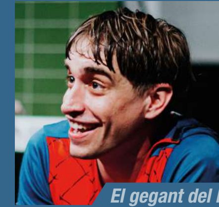
El gegant del Pi