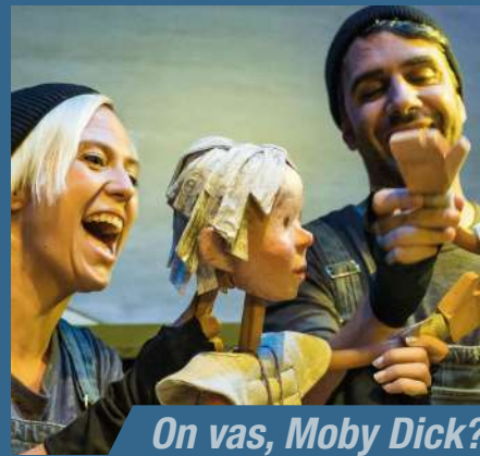
On vas, Moby Dick?