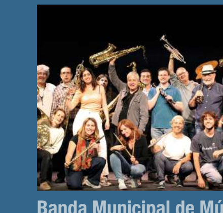
Banda Municipal de Música