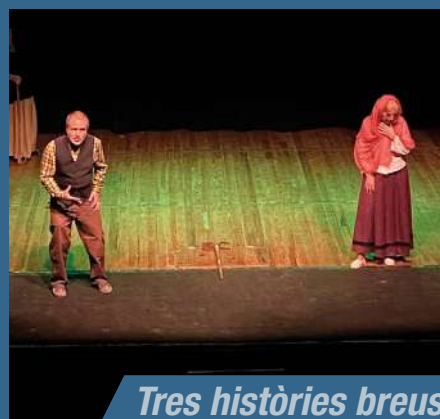
Tres històries breus