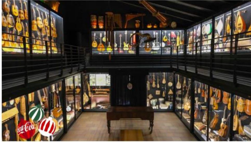
Museo de los Instrumentos de Uruña / Ayuntamiento de Uruña