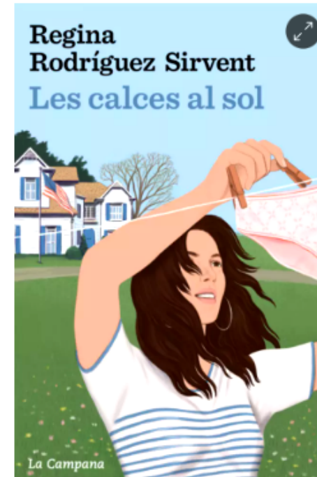
'Les calces al sol'. — La campana