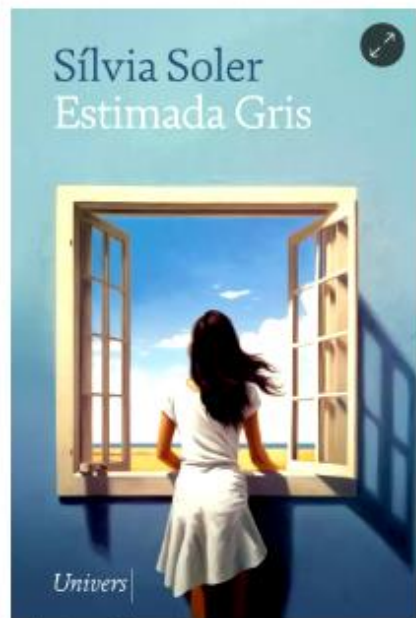
'Estimada Gris'. — Univers

Sense feina, acabada de divorciar i amb la mort del seu pare encara recent, la Gris es troba, amb quaranta anys, amb una vida a la deriva i que cada cop sent menys seva. Des de fa temps una idea li ronda pel cap: marxar ben lluny dels carrers i de la gent de Puebla, cap a la terra dels seus avantpassats, aquella Catalunya remota de què tant li havia parlat l'avi Antoni quan era petita.