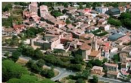
Calonge i Sant Antoni