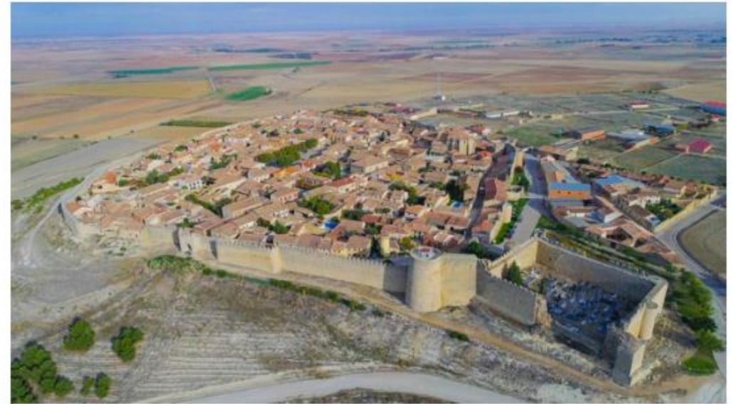
Vista del pueblo de Urueña

Este pequeño pueblo vallisoletano que ronda los 200 habitantes fue proclamado Villa del Libro en 2007 , convirtiéndose en la primera de España. Es famoso por sus librerías, porque en todo su territorio cuenta con doce, además de cinco museos. El hecho de ser el único pueblo de España que cuenta con más librerías y museos que bares llamó la atención de The New York Times en 2018. El alcalde contó al periódico americano que las autoridades provinciales decidieron invertir tres millones de euros en restaurar edificios antiguos y convertirlos en librerías, imponiendo un alquiler simbólico de diez euros mensuales, y así convertir el pueblo en un reclamo para los bibliófilos .