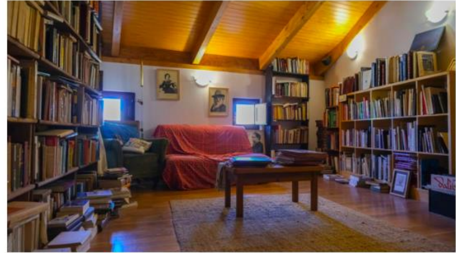
Una de las famosas librerías de Uruña

Tradicional, multilingüe, independiente, de segunda mano... Las hay de todos los tipos y para todos los gustos repartidas a lo largo del pequeño pueblo. En 2021 se registraron 19.000 visitantes y, cada año, recibe en torno a 70.000 euros para realizar actividades culturales como clases de caligrafía u obras de teatro . A sus vecinos no les interesaban los libros, según contaba su alcalde Francisco Rodríguez , pues la economía se basaba principalmente en la agricultura y la ganadería. Sin embargo, ahora parece que los libros han ganado popularidad. Gracias a este tipo de iniciativas, el conjunto histórico está muy bien conservado y el pueblo es considerado uno de los más bonitos de España . La Villa del Libro, como no podía ser de otra manera, ha inspirado a varios autores como Carmen Mola , quien situó allí alguna trama de 'La novia gitana'.