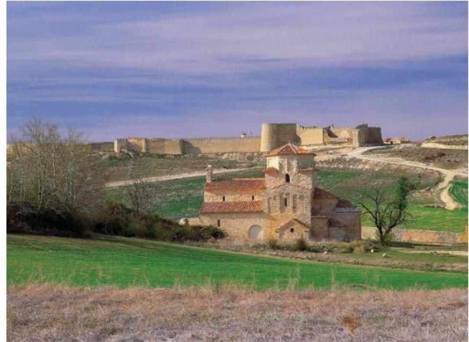
La iglesia de la Anunciada frente a la muralla.

Sin embargo, Uruña tiene mucho más que ofrecer al viajero curioso. Lo primero que se aprecia a simple vista es la muralla que lo rodea , de los siglos XII y XIII, desde la que se puede disfrutar de la mejor panorámica del pueblo. En su interior contiene un gran castillo del siglo XI , mandado construir por Fernando I El Magno y residencia de Doña Urraca. La ermita de Nuestra Señora de la Anunciada se encuentra fuera de la muralla, del siglo XI y estilo románico. La iglesia de Nuestra Señora del Azogue -construida sobre los restos de una iglesia medieval- está dentro, es del siglo XVI y combina los estilos renacentista y gótico.