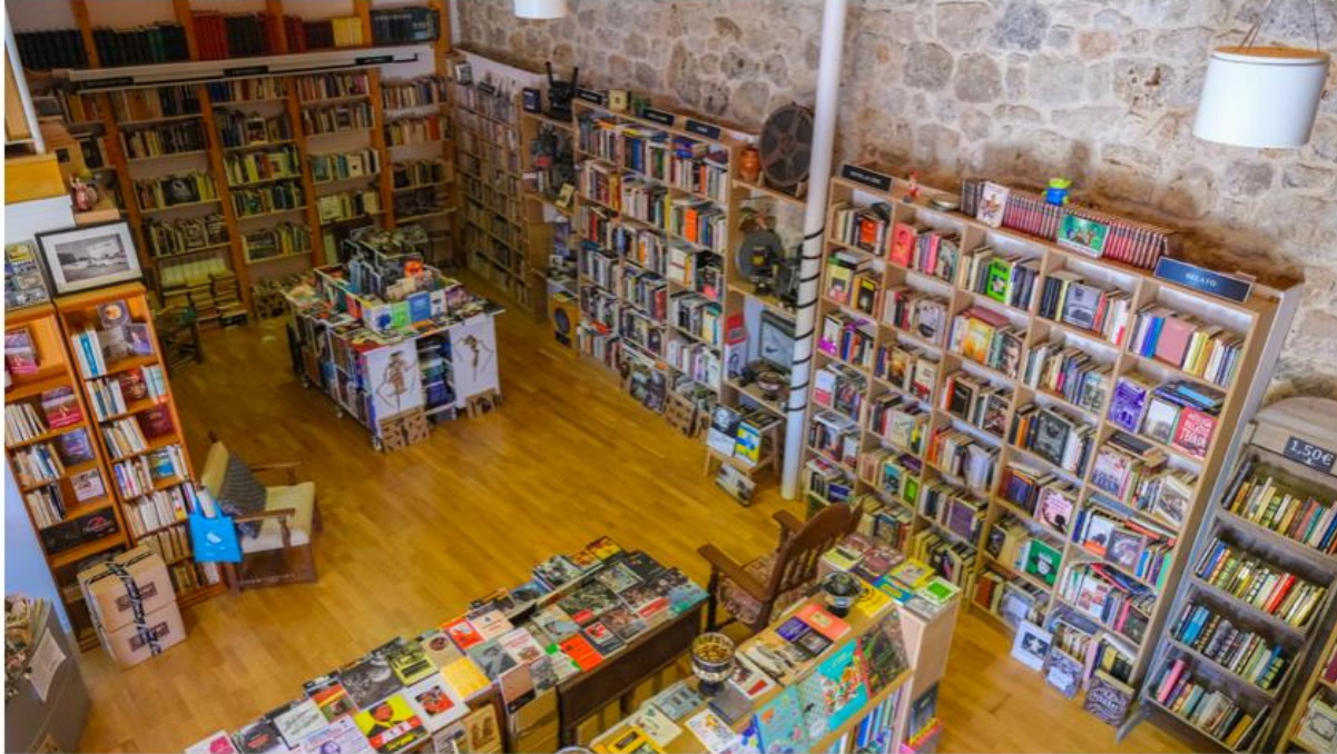
Urueña, el único pueblo de España con más librerías que bares.

El pequeño pueblo de Valladolid es llamativo por la cantidad de librerías y museos que tiene, edificios antiguos reacondicionados con la ayuda económica de las autoridades provinciales.