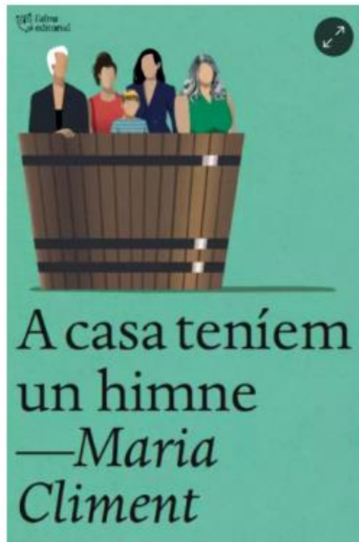
'A casa tenim un himne'.