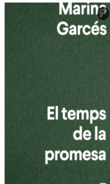
'El temps de la promesa'. — Editorial Anagrama

Aquest llibre mostra les claus històriques, filosòfiques i literàries del poder de la promesa i de la seva fragilitat actual. La promesa, ens diu l'autora, pot ser una forma de rebel·lió que introdueixi la batalla pel valor de la paraula en un present incert i en un futur amenaçat. Un text incisiu i esperançador.